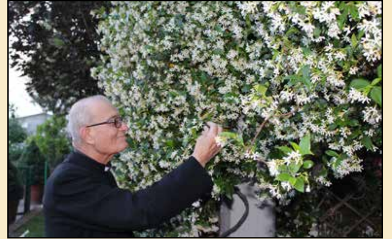
Ogni Briciola è un fiore dato con amore

40° anniversario AIDO Montichiari RICORDO DI DON LUIGI LUSSIGNOLI Primo anniversario 18 marzo 2018