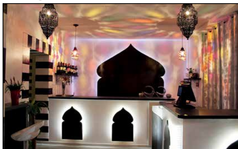
La nuova entrata del ristorante.

Oltre ai nuovi spazi, con una possibilità di un migliore servizio, per il nuovo anno è stato predisposto un menù ancora