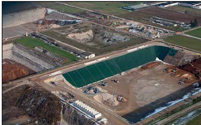
Le discariche di Vighizzolo.