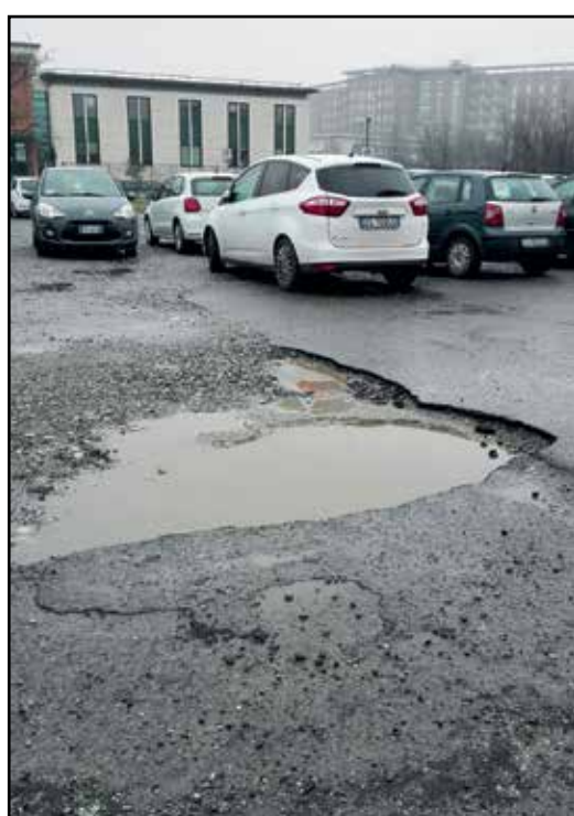
"L'eterna" buca del parcheggio esterno dell'Ospedale.

È un rimpallarsi di responsabilità fra l'ospedale ed il comune di Montichiari; il risultato è quello che ci hai evidenziato con la foto che pubblichiamo che non rispecchia la situazione in certi casi ancora più problematica.